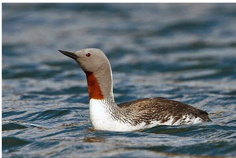
Figuur 2 Roodkeelduiker

Ook zijn in het gebied speciale rustgebieden voor vogels en zoogdieren aangewezen waarvoor permanent of in tijd en plaats restricties zijn voor het gebruik van deze gebieden. In de NRD wordt niet aangegeven hoe omgegaan gaat worden met de vereisten van het Natura 2000 gebied Voordelta en andere relevante Natura 2000 gebieden in de directe omgeving. We doen daarom een beroep op u om dit goed mee te nemen zodat voldoende inzicht beschikbaar is om natuur en landschap volwaardig mee te kunnen nemen in de verdere besluitvorming. Waarbij ook rekening gehouden moet worden met de maatregelen die in het kader van de Natuurdoelanalyse Natura 2000 gebied Voordelta zijn vastgesteld. De staat van instandhouding in dit gebied is van matig slecht tot slecht vooral voor jaarrond soorten in het gebied.