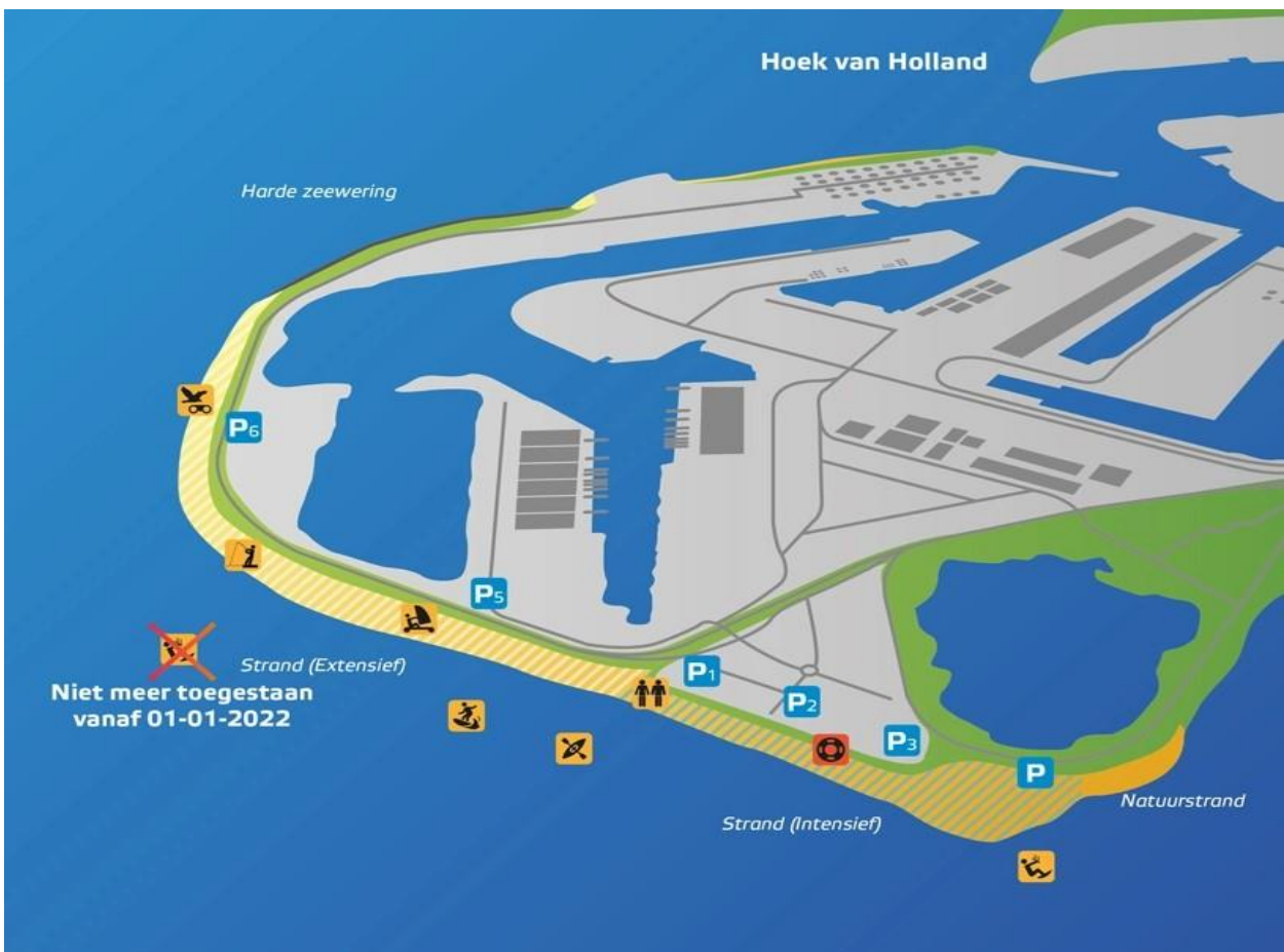
Figuur 5 zonering strand Maasvlakte II

Tijdens het strandseizoen wordt het strand van Maasvlakte II intensief gebruikt door recreanten uit Rotterdam en omliggende gemeenten. Ook zijn er een drietal Kitespots op het strand van Maasvlakte II die tussen oktober en april goed worden gebruikt. Zie figuur 3. Het recreatief gebruik van Maasvlakte II heeft een positief effect op Natura 2000 gebied Voornes Duin. De recreatie in deze duinen gaat het draagvlak van het gebied zelf te boven. Er is in Zuid-Holland al een groot recreatie tekort, als het gebruik van het Maasvlakte II strand komt te vervallen dan zoeken recreanten weer naar recreatie