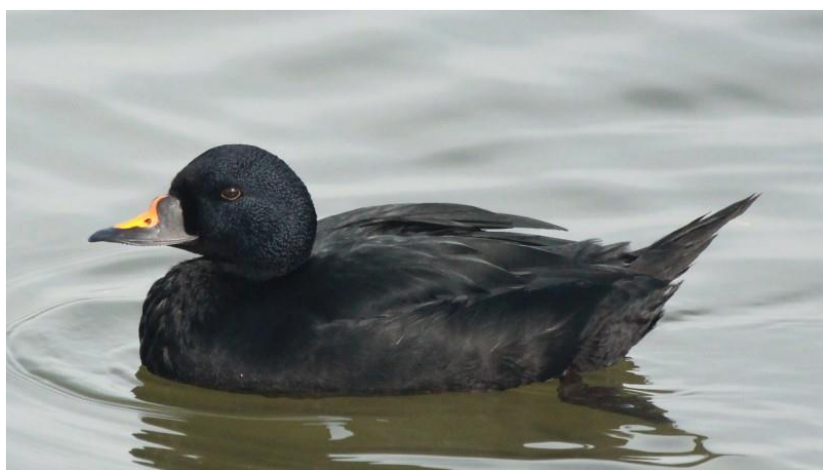
Figuur 4 Zwarte Zee-eend

Stichting Duinbehoud, Natuurmonumenten, Het Zuid-Hollands Landschap en de Natuur en Milieufederatie Zuid-Holland zijn vanaf het convenant 'Visie en Vertrouwen' in 2008 betrokken bij de wettelijk vastgesteld natuurcompensatie voor de aanleg van de Maasvlakte II (PMR) in de Voordelta. De rechtbank Midden-Nederland heeft in haar besluit van 15 november 2022 bevestigd dat de afgesproken wettelijke natuurcompensatie niet is gehaald. Recent heeft de Minister van Natuur en Stikstof voorstellen gedaan om de uiteindelijke wettelijke natuurcompensatie te gaan realiseren. Ook deze voorstellen in de Voordelta en ten noorden van de Maasmond raken aan het aanleggen van een nieuw amfibisch oefengebied Maasvlakte en gebruik daarvan in de kustzone. Finale besluitvorming over deze voorstellen gaat binnenkort plaatsvinden. Zie hiervoor figuur 2. zoals dat vorige week is gedeeld met de stakeholders en de 2 e Kamer. In de NRD wordt niet aangegeven hoe omgegaan gaat worden met de vereisten voor de wettelijke Natuurcompensatie in de Voordelta. We doen daarom een beroep op u om dit wel goed mee te nemen om voldoende inzicht te